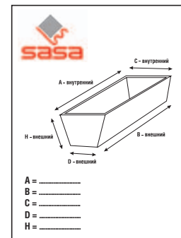
■ Размеры формы требуемые заказчиком