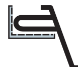
■ Установка блока на направляющие тележки